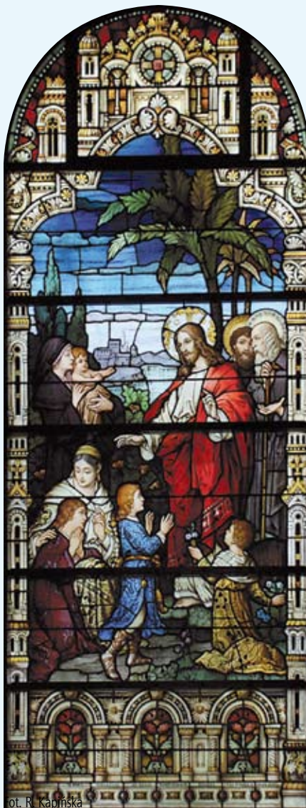
Dot. R. Kapłńska

W 1709 r. cesarz Józef I zgodził się na wybudowanie przez protestantów na Śląsku kilku kościołów, w tym w Cieszynie.