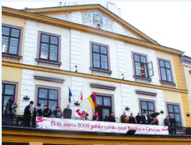
Balkon Ratusza, z którego rozpoczęto "Zjazd Krystyn"

Dla przesądnych trzynastka jest pechową liczbą, ale nie dla Krystyn. Corocznie 13 marca spotykają się by wspólnie świętować swoje imieniny. I tak było w naszym mieście.