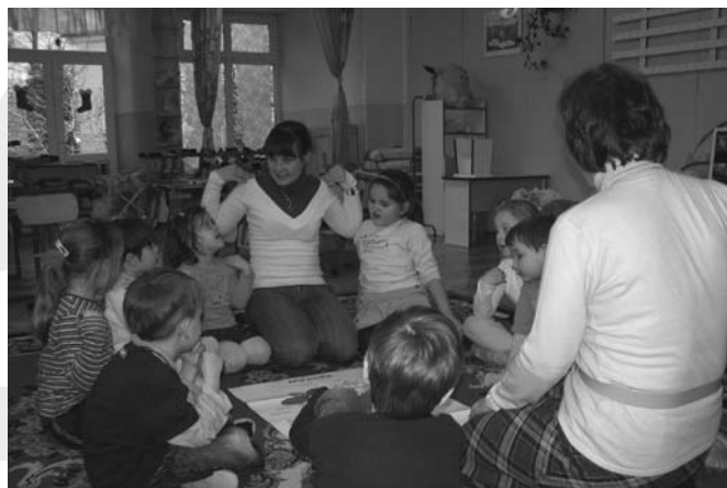
Zajęcia odbywające się w ramach projektu

Najwięcej dzieci, bo aż 260, bierze udział w zajęciach muzycznych. Na drugim miejscu pod względem dotychczasowej liczby uczestników