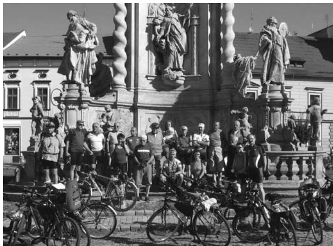
W zabytkowych miastach