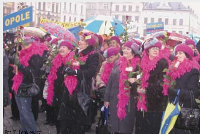
Fot. T. Lenkiewicz